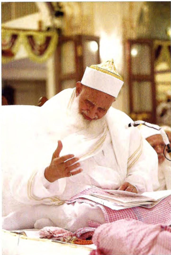
ليلة القدر سنة ١٤٢٩هـ في تصوير