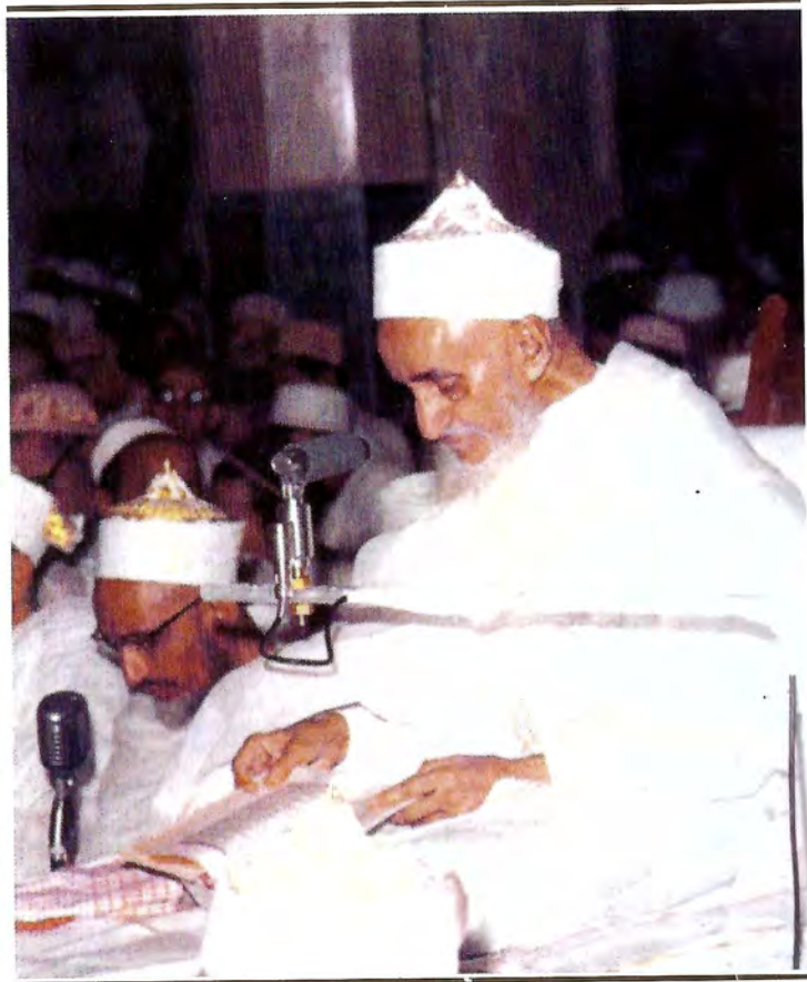
ليلة القدر سنة ١٣٨٤هـ في تصوير